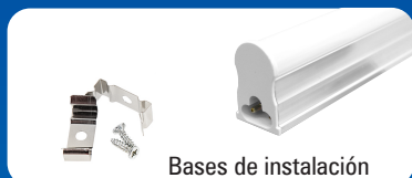
Bases de instalación

1. Instale las bases y ajuste la luminaria sobre estas.