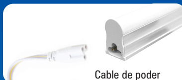
Cable de poder

2. Use el multiconector para una configuración en serie.